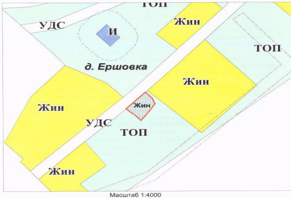
Фрагмент карты градостроительного зонирования территории Пихтовского сельсовета Кольванского района Новосибирской области

площадь 1429 кв.м. кадастровый квартал 54:10:031601 геодезические данные: н1 х=577 864,83 у=4 171 228,12; н2 х=577 852,42 у=4 171 239,07; н3 х=577 840,74 у=4 171 244,07; н4 х=577 827,92 у=4 171 236,48; н5 х=577 805,44 у=4 171 220,31; н6 х=577 814,93 у=4 171 212,35; н7 х=577 825,60 у=4 171 200,23; н8 х=577 830,01 у=4 171 195,72.